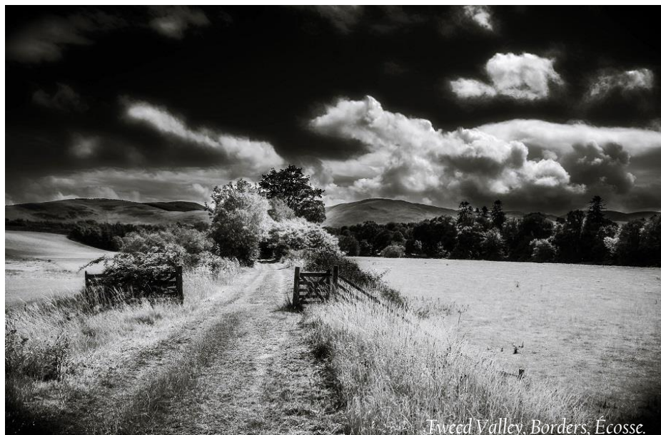
Tweed Valley, Borders, Écosse.