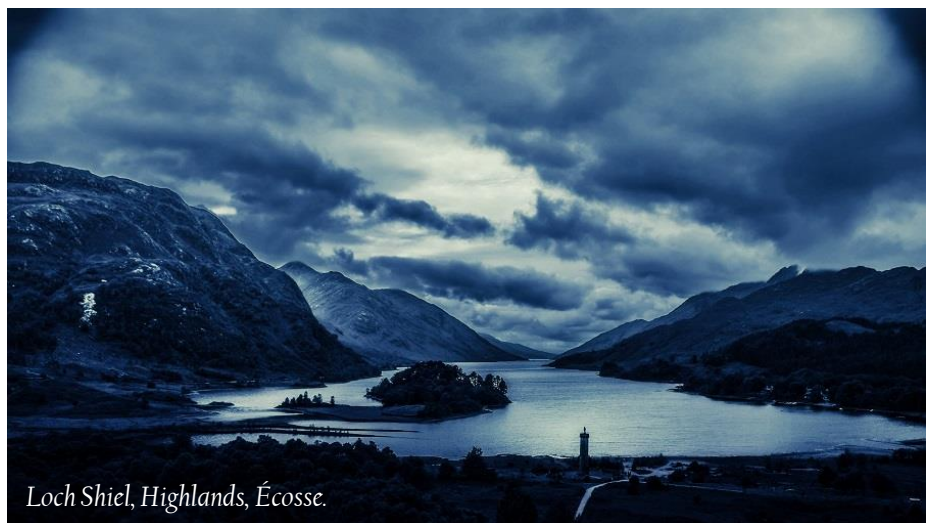
Loch Shiel, Highlands, Écosse.