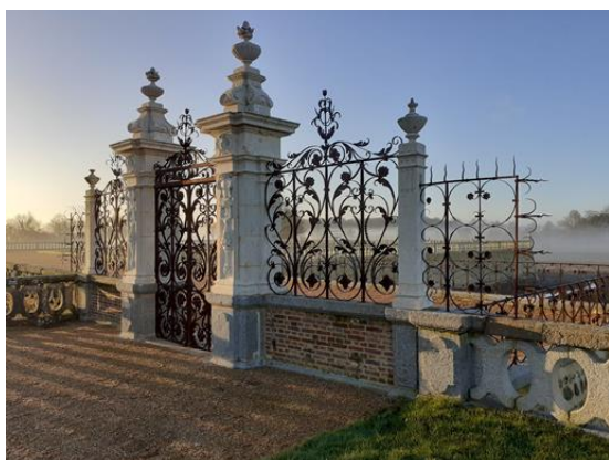
Château de Carrouges, grille d'honneur