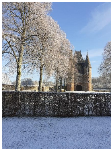
Château de Carrouges, instant givré

Suivez-nous sur Facebook @ChateauDeCarrouges